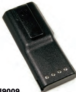
HNN9009 Batería alta capacidad serie PRO5150