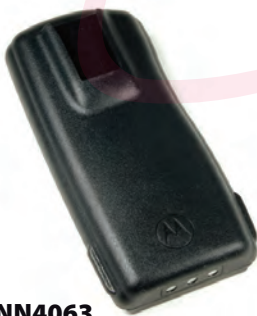
PMNN4063 Batería estándar Nicd, (PRO2150)