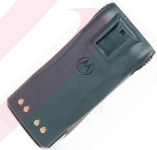
PMNN4018 Batería NiMH alta capacidad PRO3150