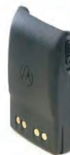
JMNN4024 Batería alta capacidad PRO5150 Elite