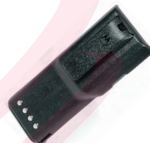
PMNN4016 NIMH 1200 mAh