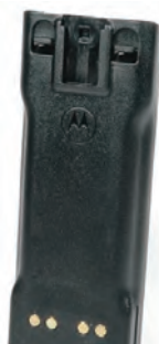
NTN7143 Batería, 1200 mAh, HT1000 / MTX