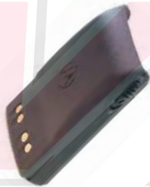
PMNN4073 Batería litio IP67-FM Elite 1400 mAh