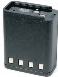
NTN5521 Batería, 1100 mAh, P200