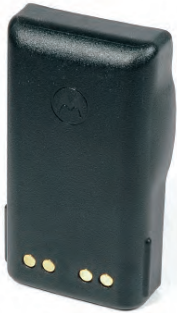
NTN7394 Batería, 1500 mAh, Visar, Ni-Mh