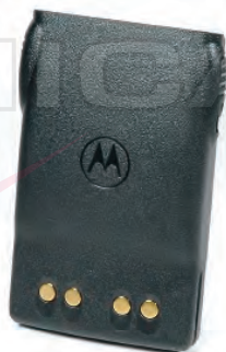
JMNN4023 Batería estándar PRO5150 Elite