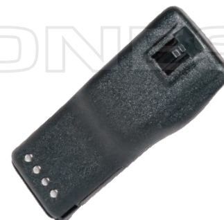
HNN9360 Batería, 1100 mAh, GP350