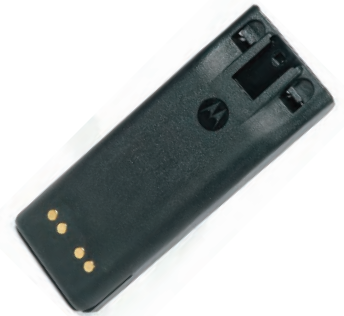
WPNN4013 Batería, 1400 mAh, HT1000/MTX