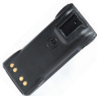
HNN9008 Batería, 1500 mAh, PRO5150,7150