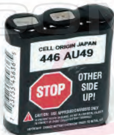
HNN9044 Batería, 550 mAh, SP50