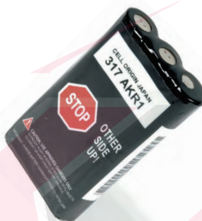
HNN9018 Batería, 1200 mAh, SP50