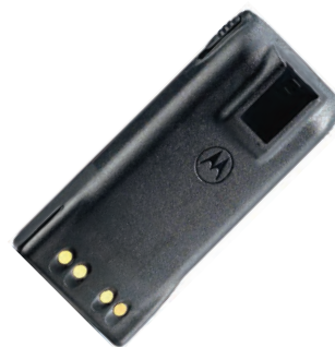
HNN9010 Batería Nicd Premium 1200 MAH Intrínseca