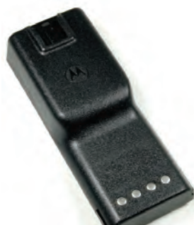
HNN9701 Batería, intrínsecamente segura para GP300 y GTX