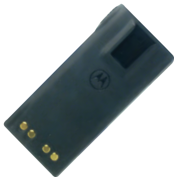
HNN9013 Batería de ion-litio para PRO5350/PRO7350